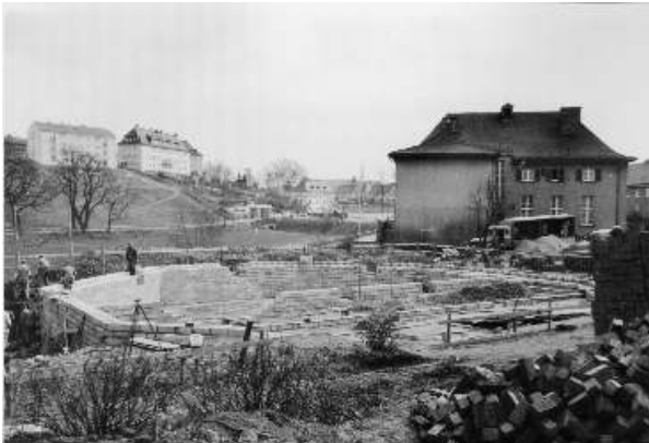
Grundsteinlegung für die Lutherkirche am 31.10.1954